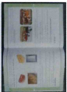
教具・教材の提供