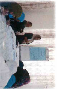
教師の養成・授業の運営