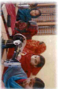
生活向上プログラム