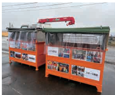
BOX(大) 屋根付き 1基 約1.8m×1.5m