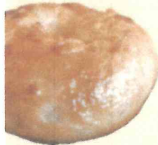
粒あん・芋・チョコナッツ 季節のベーグル 400円