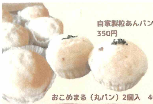
自家製粒あんパン 350円