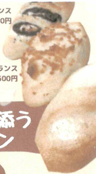
おこめバゲット 400円