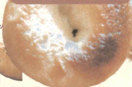
おこめベーグル 350円